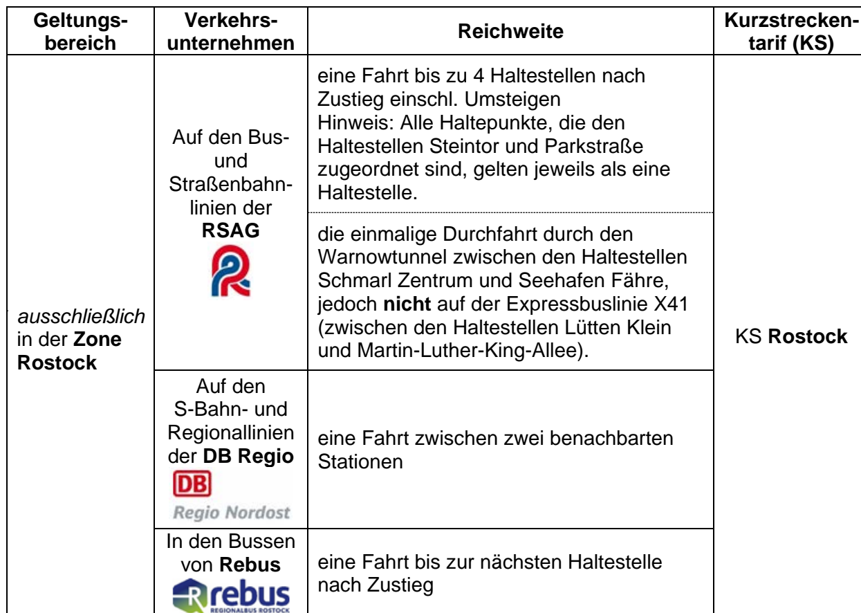
Tabelle 1: Gültigkeitsbereich der Einzelfahrkarten für eine Kurzstrecke

Der Gültigkeitsbereich der Einzelfahrkarten für eine Kurzstrecke ist in Tabelle 1 nach den Merkmalen Geltungsbereich , Verkehrsunternehmen , Reichweite und Kurzstreckentarif beschrieben.